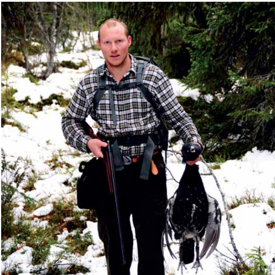
TIURFANGST. Vi vet ikke hvem som felte den. Sannsynligvis begge to.

Jeg bare måper og ler. Vet det er sant. Det er ikke samme problemet i min fryser, så fuglene havner der... ■