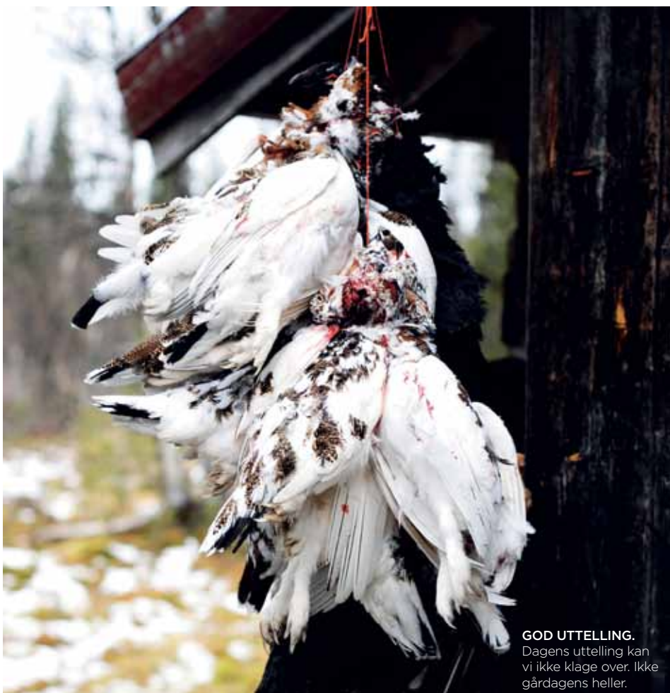
GOD UTTELLING. Dagens uttelling kan vi ikke klage over. Ikke gårdagens heller.