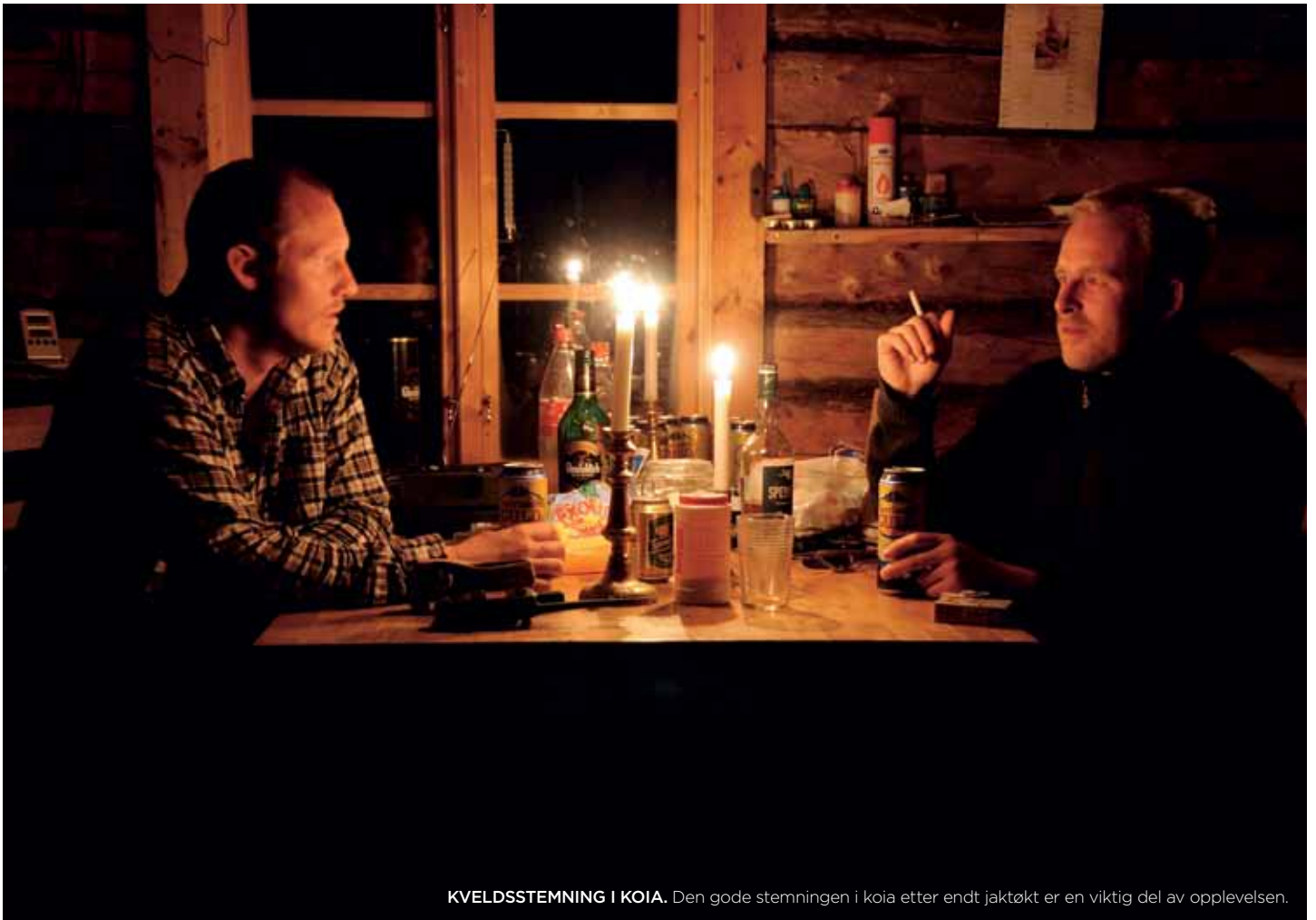
KVELDSSTEMNING I KOIA. Den gode stemningen i koia etter endt jaktøkt er en viktig del av opplevelsen.